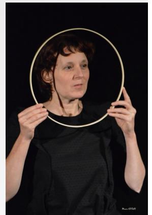
au « Café de Fleur »