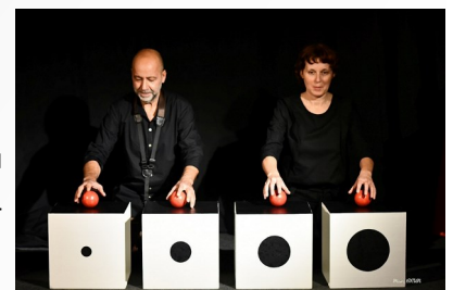
Un spectacle visuel et musical dès un an.