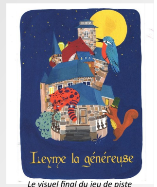
Le visuel final du jeu de piste